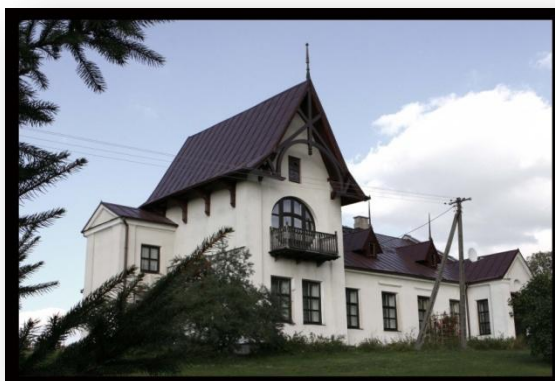
Zdjęcie 4. Plebania w Nowej Wsi

Jest to budowla o nieregularnych kształtach, rozczłonkowana i asymetryczna. Budynek jest usytuowany na małym wzgórzu w sąsiedztwie kościoła. Zbudowany na planie prostokąta, dwukondygnacyjny z dobudowaną częścią trójkondygnacyjną w kształcie przypominającym wieżę. Fundamenty budowli zostały wykonane z kamienia na zaprawie cementowo-wapiennej. Ściany nośne zostały wykonane z pełnej cegły ceramicznej, stropy z belek drewnianych. Otwory na parterze mają kształt prostokątny. Na piętrze, w ścianie frontowej występuje duży okrągły otwór okienny z drzwiami sięgającymi posadzki. Jest to tzw. Porte-fenetre (z francuskiego drzwi-okno), efektowne połączone drzwi z rozetowym oknem w nowym, secesyjnym stylu. Budowla zwieńczona jest dwuspadowym dachem. 2