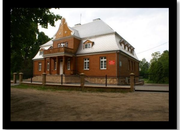
Zdjęcie 2. Obiekt dworu w Przystani po remoncie