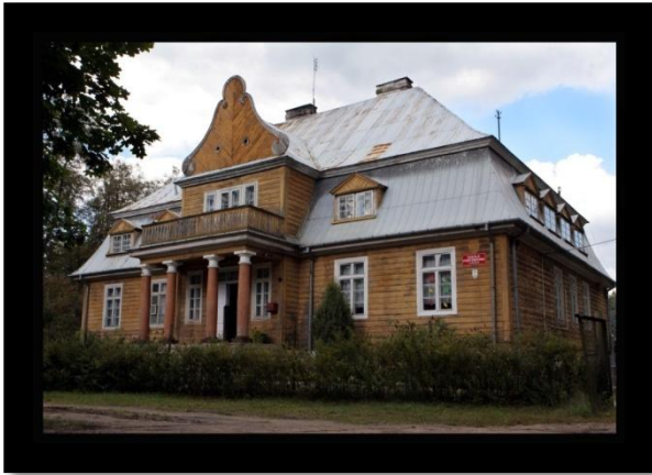
Zdjęcie 1. Obiekt dworu w Przystani przed remontem