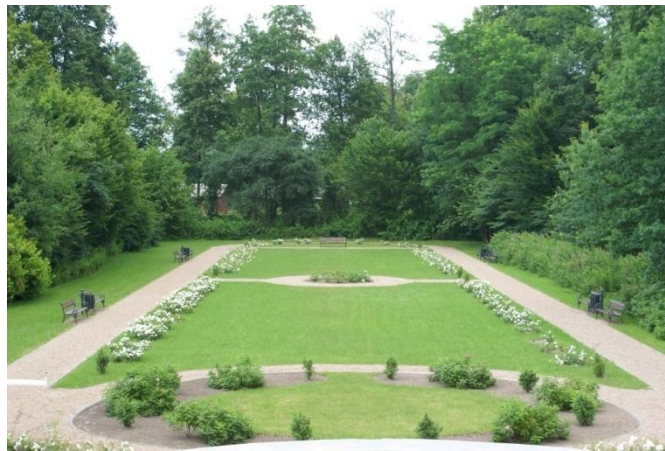
Zdjęcie 3. Park w Przystani

Kolejnym etapem projektu była realizacja zagospodarowania terenu, polegająca na odnowieniu ogrodzenia od frontu obiektu oraz ułożenie kostki brukowej przed budynkiem i wjazdu. Zagospodarowanie terenu obejmowało także rewaloryzację zabytkowego parku położonego na tyłach obiektu. Projekt rewaloryzacji założenia dworsko-parkowego przygotowała firma „Zaczarowany Ogród” z Warszawy. W ramach rewaloryzacji usunięto drzewostan samosiewny, wykonano nowe nasadzenia roślin, nawodnienie oraz odtworzono alejki wraz z stylizowanymi ławeczkami.